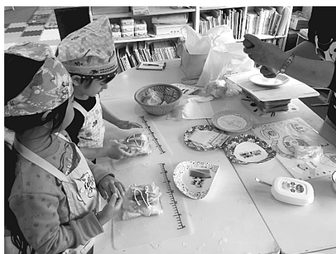
写真5 ランチクッキングの時間の様子 (2018年11月22日)

その後、お昼ご飯を食べ、午後の時間になると3歳未満児と3歳以上児で活動を分けて過ごす。写真4の部屋で、3歳未満児はお昼寝を行う。3歳以上児は、写真6のように一人ひとりがどのように過ごすのかを保育士と相談して決める。21日は支援員の牧場に行ったり(写真7)、22日には文字や数のドリルを使いながら練習を行っていた(写真8)。その後、皆でおやつを食べ、順次降園となる。