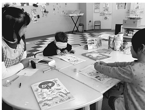
写真8 お絵描きやドリルをする園児 (2018年11月22日 筆者撮影)