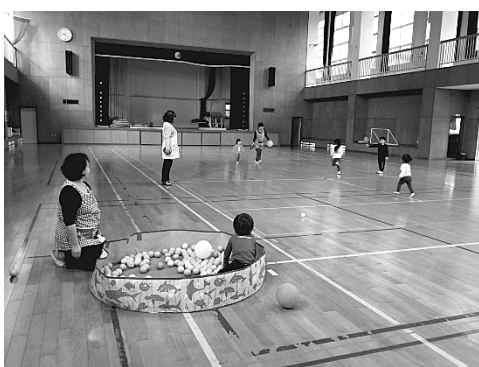
写真2 三島村総合体育館で遊ぶ様子 (2018年11月21日 筆者撮影)