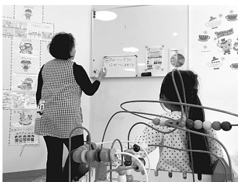
写真6 保育士とともに時間を決める様子 (2018年11月21日)