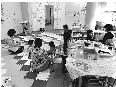
写真3 保育室での制作の時間の様子 (2018年11月21日 筆者撮影)