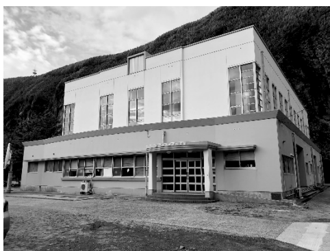
写真1 「つばき園」のある三島村総合体育館 (2018年11月21日)

設備だけでなく、子育て支援制度の充実に向けての動きもみられる。2012年8月「子ども・子育て支援法」が成立し、2015年4月から「子ども・子育て支援新制度」の取り組みが行われている。2015年1月号の「広報みしま」では、こうした国の取り組みを踏まえ、「三島村子ども・子育て会議」を開催、「三島村子ども・子育て支援計画」を策定し、三島村の状況を踏まえて、子育て支援の在り方を模索しようとする様子がうかがえる。