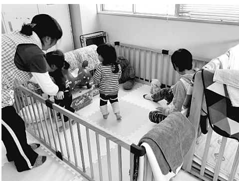
写真4 未満児がお昼寝をする部屋 (2018年11月22日 筆者撮影)