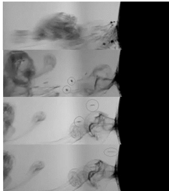
図4 液滴発生時の写真

このことから、磁性流体をレーザーアブレーション推進の推進剤として用いることは、固体の推進剤を用いる場合と比較して、推進剤が無駄になる可能性が抑制される魅力的な推進剤となりうる可能性が示された。