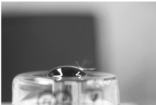
図3 レーザーアブレーションの様子

図3より、レーザー光線が散乱されてレーザーの軌跡が見られることから、磁性流体がアブレーションして周囲に粒子が漂っていることがわかる。また、図4に示すとおり、この際、照射前後で形状に変化がないことがわかった。