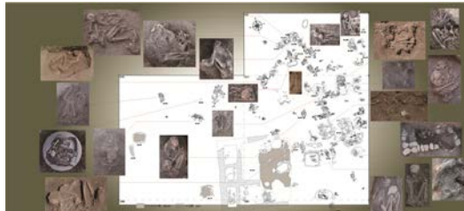
発見されたケルク新石器時代墓地

年度の発掘調査で、紀元前 6500 年に遡る土器新石器時代の墓地が検出された。その後この墓地からは本研究申請の時点までで 87 体（2010 年度調査までで 241 体）もの人骨が出土しており、これまでに判明している屋外型の本格的な墓地としては西アジアで最も古く、世界史的に見ても最古の墓地と考えられた。