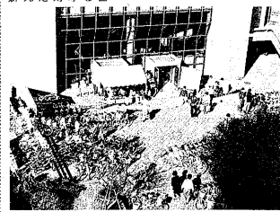
宿舎・厚生施設（1984年4月6日撮影）

宿舎・厚生施設の問題は、学生にとって非常に重要な課題である。学生は、受け手としてしか扱われていない。大学側は、学生の生活環境を改善するために努力している。しかし、学生側は、もっと積極的に意見を述べてほしいと求めている。