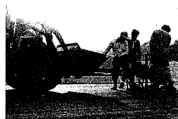
万博会場周辺は整備がすすむ