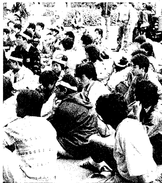
学園祭の開催をめぐり本部棟前に集り込む学生（1984年10月2日）

学園祭の中止は、学生側から強く求められていた。しかし、大学側は「許可制」を導入し、機動隊の導入も検討していた。学長は、この問題について、酒席に出席し、学生と対話を行った。しかし、学生側は「許可制」を認めず、学園祭の中止を要求した。この結果、学園祭は中止となり、学生側は機動隊の導入に抗議した。